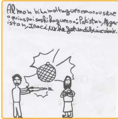
La guerra Autora: Shazia

El grup de grans de l'Aula Oberta vam estar pensant i parlant sobre la violència, les armes, la guerra i la pau. Hem arribat a la conclusió de que no ens agraden ni la guerra ni la violència, que ens agrada la pau. A Pakistan hi ha llocs on hi ha guerra i ens fa por. Volem la pau.