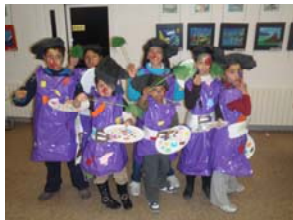
© Grup de petits de l'Aula Oberta

El Centre Obert és un projecte diari on treballen avis, actituds, deures i coses més divertides. El Centre Obert existeix per a que els nens puguin tenir un espai per a relacionar-se de manera positiva i aprenguin coses i a vegades es diverteixen.