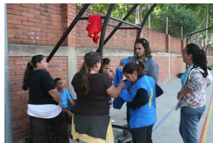
© Grup de petits de l'Aula Oberta

I també ens ho han explicat que han fet per la Fira d' Artesania: llibretes, gots, clips per cabells.