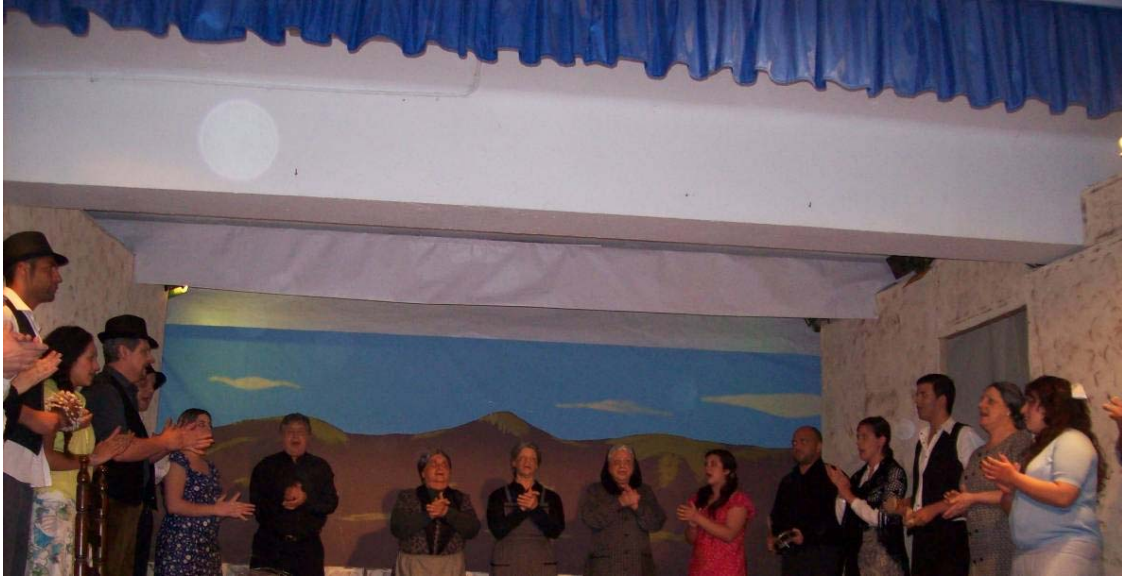
© Grup de petits de l'Aula Oberta

Hem fet quatre representacions de diferents del barri de Badalona. L'han vista més de 400 persones i ha agradat molt si, tenim prebis diferents llocs.