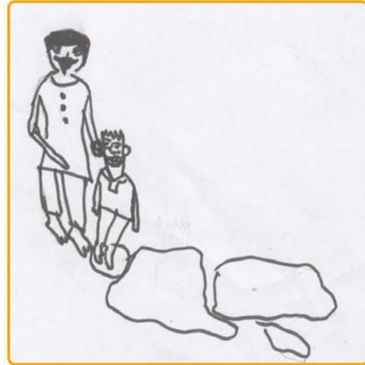
La guerra Autora: Sundas