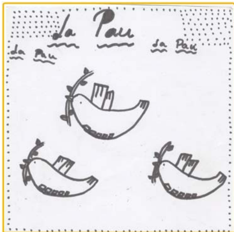
La pau Autora: Sunita