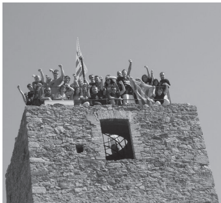
LA PUJADA A SANT MIQUEL

A la tarda, la manifestació independentista de la Diada a Girona, convocada per la CUP i Maulets, amb el suport de múltiples organitzacions i col·lectius de les comarques gironines, va aplegar més de 5.000 persones que van recórrer els carrers de la ciutat enmig d'un clima festiu i reivindicatiu.